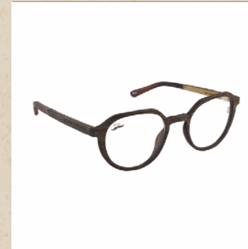
Lunettes en bois SORRETA

Monture élégante aux formes arrondies, ce modèle est particulièrement adapté aux visages fins. Les amoureux de la nature et du style pourront arborer fièrement ces lunettes en bois.