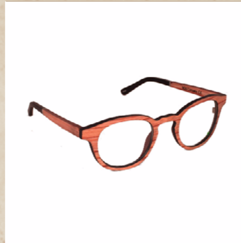
Lunettes en bois TOSH (Small)

Découvrez nos lunettes en bois Océa déclinée avec différentes essences de bois inédite, le bois de Liquidambar, le bois de Cumaru et le bois d'Ébène de Macassar/bois de Cumaru et le bois de Noyer