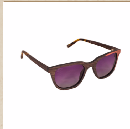
Lunettes en bois OIATU

Nous avons sélectionné comme essences de bois : l'érable teinté dans la masse rouge, l'érable teinté dans la masse bleu, le cumaru/zébrano et l'ébène/cumaru.