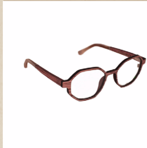
Lunettes en bois Océa (Médium)

Découvrez nos lunettes en bois Tosh déclinée avec différentes essences de bois inédite, le bois de Frake, le bois de Frake bariolé et le bois de Noyer