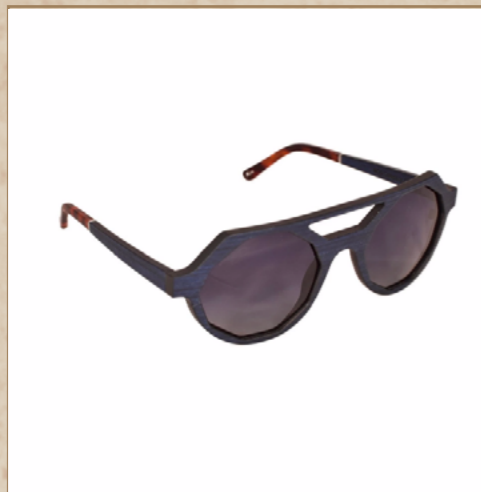
Lunettes en bois EG'UZKI

Soyez surpris par nos lunettes de soleil EG'UZKI. Design original et couleurs excentriques pour un look ultra stylé.