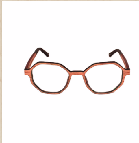
Lunettes en bois Océa (Small)

Découvrez nos lunettes en bois Tosh déclinée avec différentes essences de bois inédite, le bois de Santal, le bois de Cumaru et une alliance de bois d'Ébène de Macassar et de Cumaru