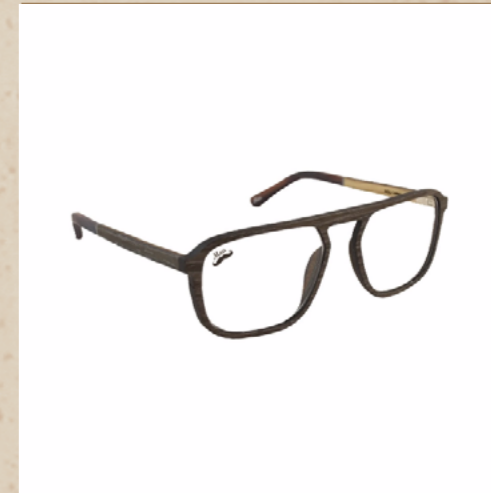
Lunettes en bois JATORRI

Nous avons déclinés ce modèle en utilisant trois essences de bois différents et tout aussi singulière l'une que l'autre.