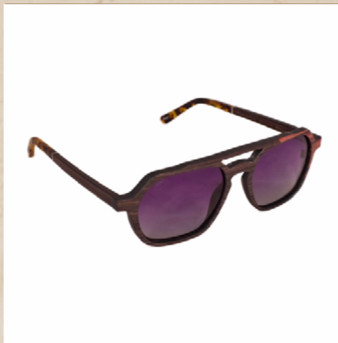
Lunettes en bois GATZAK

La monture Olatu est gracieuse par ses formes arrondies. Nous avons décliné ce modèle en deux déclinaisons avec une alliance de bois inédite, le cumaru/zébrano et l'ébène/cumaru.