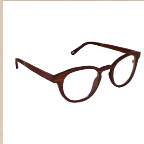
Lunettes en bois TOSH (Médium)

Monture emblématique, découvrez ce modèle décliné avec différentes essences de bois.