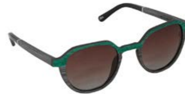
BETIKOA 86 C022