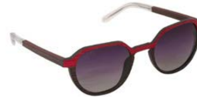
BETIKOA 86 C023