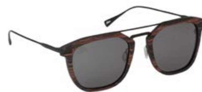
LAPURDI CTW 8940

Les lunettes bois de notre Light collection, illustrent désormais l'innovation recherchée par nos équipes pour vous proposer des lunettes de vues confortable et tendance au quotidien. Chez Mou Company, nous avons opté pour un design épuré et une alliance de matériaux inédits. Vous retrouverez sur cette light collection le bois, essentiel de nos montures, le carbone et le titane. Le résultat naturel et ultra léger de cette collection reflète le savoir-faire manuel d'exception recherché pour vous.