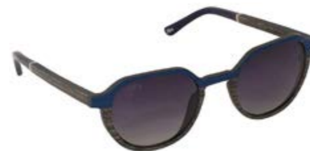
BETIKOA 86 C024