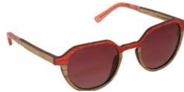
BETIKOA 86 C021