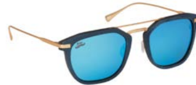
LAPURDI CTW 8950